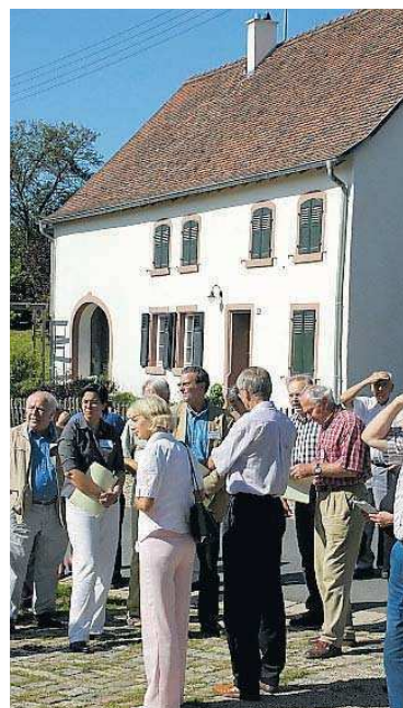
Schmucke Bauernhäuser prägen Altheim.